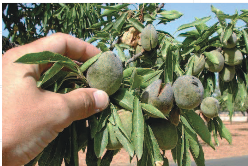
Las cooperativas agroalimentarias recuerdan que la plaga de la 'Xylella' está todavía presente en los campos.

Según explican los responsables de las cooperativas, durante el mes de enero la almendra se cotizaba en la lonja de Reus (la