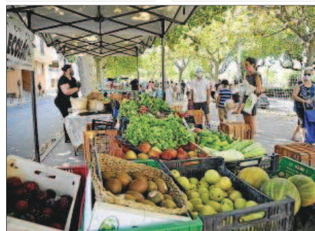
La semana pasada, los agricultores volvieron a Santa Maria.

El fomento del producto agrícola y ganadero de kilómetro cero también pasa,